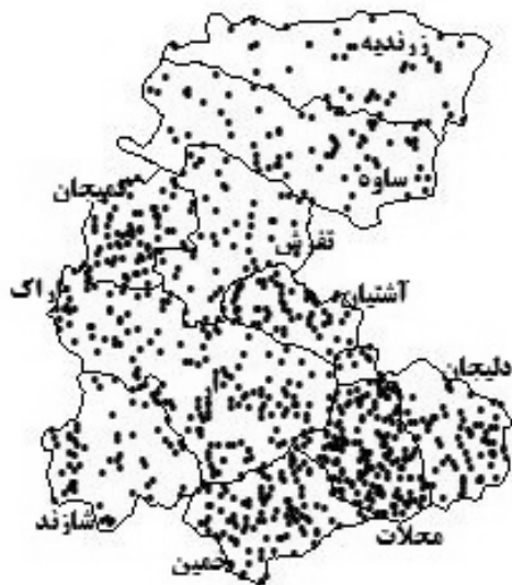
شکل ۱: پراکنندگی میزان بروز سرطان پوست در شهرستان‌های استان مرکزی ۱۳۹۰-۱۳۸۶.

همان‌طور که در جدول ۱ نشان داده شده است بیشترین موارد ثبت‌شده مربوط به گروه سنی ۷۰-۷۹ سال ( 28.8\% ) و کمترین موارد مربوط به گروه سنی زیر ۳۰ سال ( 2.2\% ) است. در طی پنج سال مطالعه بیشترین میزان بروز، در افراد بالای ۸۰ سال و کمترین در افراد زیر ۳۰ سال بود. در شکل یک نیز مشاهده می‌شود که خمین بیشترین و شازند کمترین بروز را در طی پنج سال داشته است.