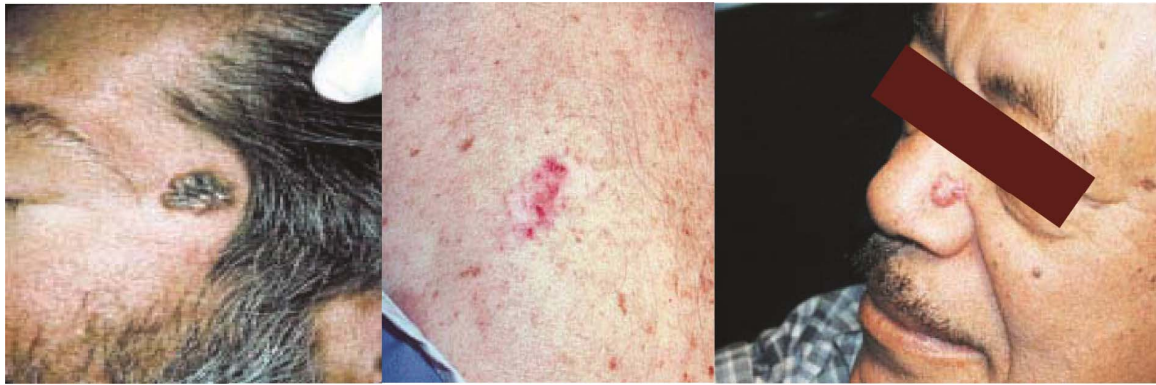
الف ب ج