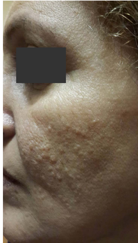
شکل ۱: پاپول‌هایی به رنگ پوست در ناحیه‌ی گونه در بیمار با استئوماکوتیس ارزنی.

درمان می‌تواند به صورت دارویی، جراحی یا ترکیبی از هر دو باشد. درمان‌های موضعی مثل رتینوئیک اسید با تأثیر بر لایه‌ی رتیکولار درم باعث نتایج خوبی می‌شود. etidronate disodium با مهار بازجذب کلسیم و تأثیر در متابولیسم استخوانی از روش‌های درمانی دارویی می‌باشد. سایر روش‌ها مانند الکتروکوتر، لیزر، درم ابریشن و برداشتن جراحی نیز در درمان استفاده می‌شوند. ۵ در این بیمار ضایعات کوچک‌تر تحت درمان با رادیوفرکشنسی قرار گرفت و برای ضایعات بزرگتر برداشتن جراحی انجام شد که از نظر زیبایی نتایج بهتری داشت.