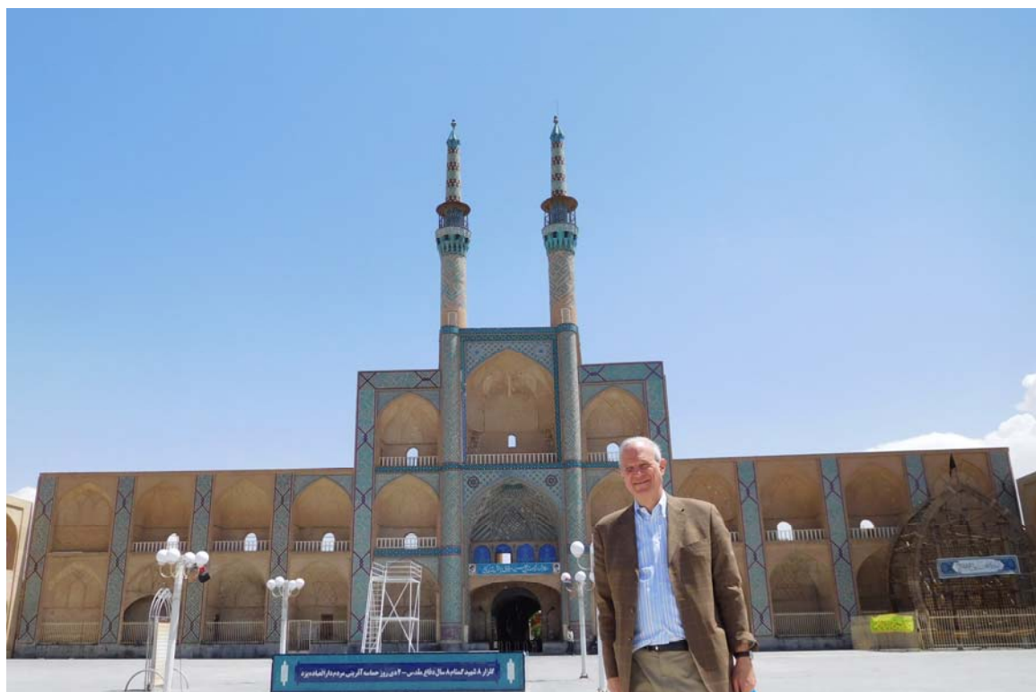
Fig 8. Ancient desert city of Yazd with its magnificent Amir Chahmaq Complex