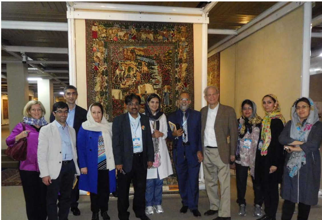
Fig 6. Tehran's famous Carpet Museum attracts congress guests