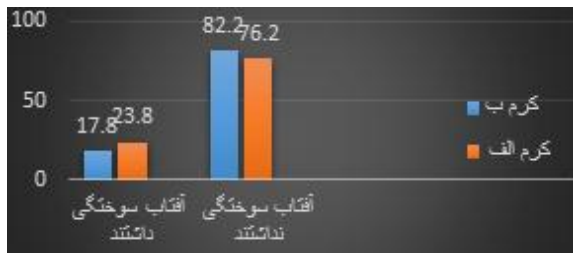
شکل ۲: میزان آفتاب‌سوختگی و پیشگیری از آفتاب‌سوختگی به تفکیک گرم‌های مصرفی