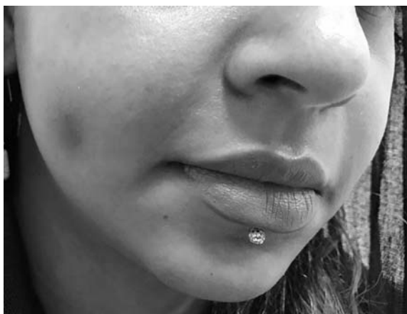
شکل ۱: محل چال گونه

در تکنیک اولیه‌ای که به وسیله‌ی Bao و همکارانش توضیح داده شده است، پس از بی‌حس کردن موضع و درحالت خوابیده به پشت (supine)، انسزیون کوچک دو تا سه میلی‌متر در مخاط دهان داده می‌شود. از