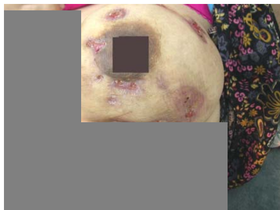
شکل ۲: زخم‌های متعدد ترشح‌دار در هنگام مراجعه

توجه و به‌خاطر داشتن این بیماری مهم است چراکه اغلب بیماران خانم‌های جوان و فعال هستند و اشتباه در تشخیص این بیماری می‌تواند عواقب اقتصادی، اجتماعی و روانی قابل توجهی داشته باشد. مشخص شدن علت، تشخیص زودهنگام و سریع و پروتکل درمانی معین و مناسب آن می‌تواند از پیامدهای ناگوار جلوگیری نماید. ۴