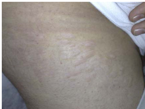
شکل ۱: ضایعات جلدی بیمار

اندازه کوچکی داشته و روی اندام‌ها ایجاد می‌شوند و نیز retiform که بزرگتر بوده و معمولاً روی تنه ایجاد می‌شوند تقسیم می‌شوند ۴ . با توجه به این موارد مورد معرفی شده در این گزارش یک فرم ایزوله خال بافت همبند را نشان می‌دهد که با اختلالات سیستمیک همراهی نداشته و سابقه خانوادگی نیز ندارد و لذا یک فرم غیروراثتی به‌شمار می‌رود.