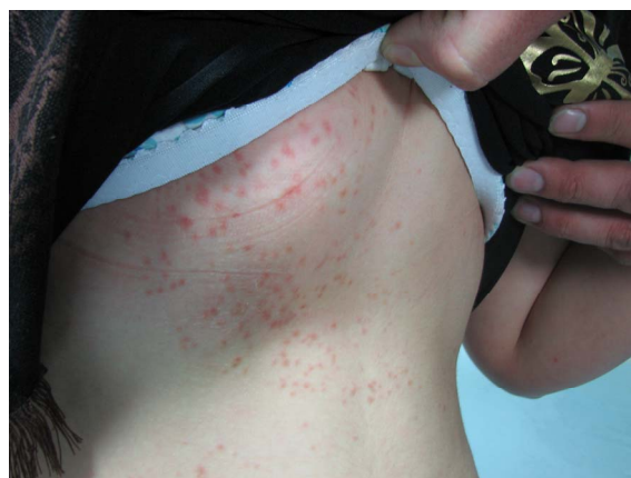
شکل ۲: پاپول‌های قرمز روی سینه و شکم.

از نظر بالینی، سیرینگوما ممکن است با هایپرپلازی سباسه، آکنه ولگاریس، میلیا، گزانتوما بثوری، کهیر رنگدانه‌ای، هیدروسیتوما، تریکوآپیتلیوما و گزانتلازما در صورت و گرانولوم آنولر در تنه اشتباه شود. ۳،۵