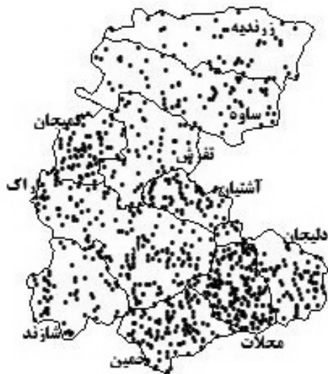
شکل ۱: پراکنندگی میزان بروز سرطان پوست در شهرستان‌های استان مرکزی ۱۳۸۶-۱۳۹۰.

همان‌طور که در جدول ۱ نشان داده شده است بیشترین موارد ثبت‌شده مربوط به گروه سنی ۷۰-۷۹ سال ( 28.8\% ) و کمترین موارد مربوط به گروه سنی زیر ۳۰ سال ( 2.2\% ) است. در طی پنج سال مطالعه بیشترین میزان بروز، در افراد بالای ۸۰ سال و کمترین در افراد زیر ۳۰ سال بود. در شکل یک نیز مشاهده می‌شود که خمین بیشترین و شازند کمترین بروز را در طی پنج سال داشته است.