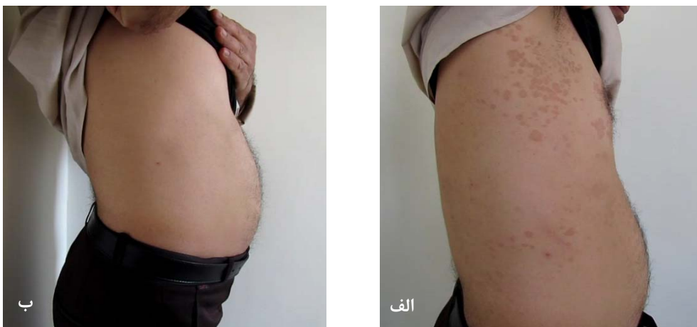
شکل ۲: تأثیر استفاده از شامپوی کتوکونازول ۲٪ بر بیمار مبتلا به پیتیریا‌زیس ورسیکالر؛ الف) قبل از درمان، ب) بعد از ۳ هفته درمان.

جدول ۱: میزان بهبودی عوارض و علائم در بیماران مبتلا به پیتیریا‌زیس ورسیکالر پس از ۳ هفته استفاده از شامپوی کتوکونازول ۲٪