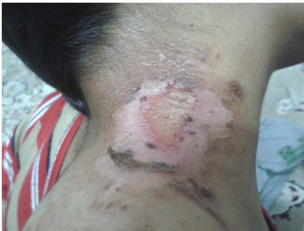
شکل ۶: درماتیت پدروسی ۹ روز پس از تماس با حشره.