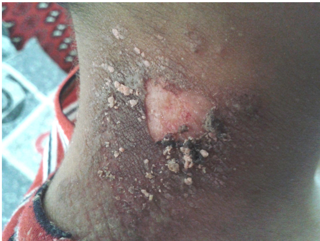
شکل ۵: درماتیت پدروسی ۶ روز پس از تماس با حشره.