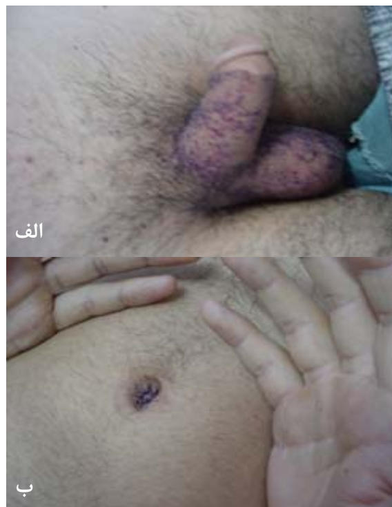
شکل ۱: ضایعات پوستی مشخصه‌ی بیماری فابری؛ الف) آنژیوکراتوم‌های متعدد روی اسکروتوم و آلت تناسلی، ب) آنژیوکراتوم‌های متعدد در اطراف ناف (periumbilical rosette)

کوچک به‌رنگ قرمز تیره به‌خصوص روی پهلوها، ران‌ها، ناحیه‌ی تناسلی و اطراف ناف که از کودکی ایجاد شده بودند، مشاهده شد (شکل ۱). در معاینه‌ی چشم تلانژکتازی ملتحمه و cornea verticillata مشاهده شد. در شنوایی‌سنجی، اختلال در رفلکس آکوستیک وجود داشت. الکتروکاردیوگرام و آزمایشات ادراری به‌عمل آمده طبیعی بودند. به‌منظور بررسی بیشتر برای بیمار مشاوره‌های مختلفی ازجمله نورولوژی، قلب و اورولوژی درخواست شد که به‌دلیل اعزام وی به خدمت سربازی انجام نشدند. در بیوپسی انجام‌شده هیپرکراتوز، آکانتوز، پاپیلوماتوز و پرولیفراسیون‌های عروقی متسع با یک لایه پوشش آندوتلیال صاف در درم پاپیلر مشاهده شد (شکل ۲).