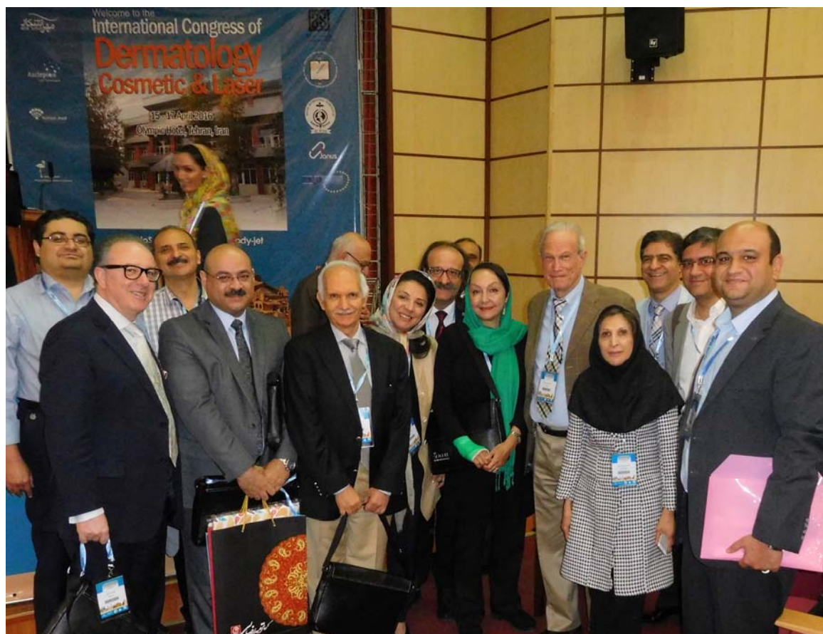
Fig 9. Closing ceremony with grateful attendees