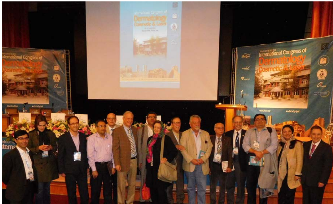
Fig 1. The Congress assembled