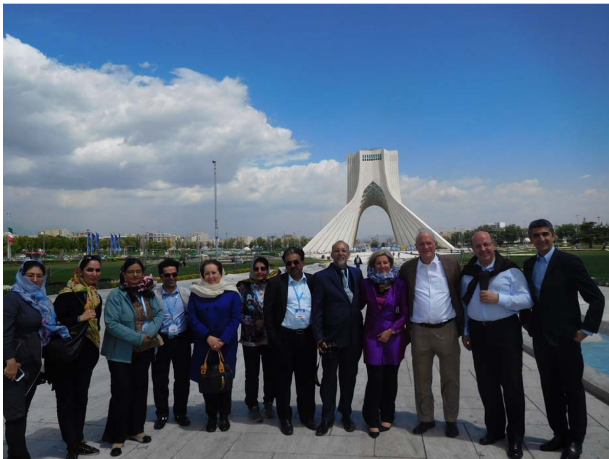
Fig 7. Azadi (Freedom) Monument, Tehran, with admiring congress attendees