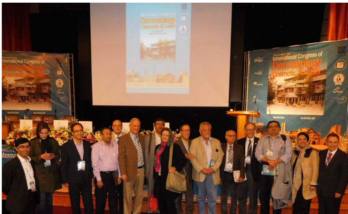
Fig 1. The Congress assembled