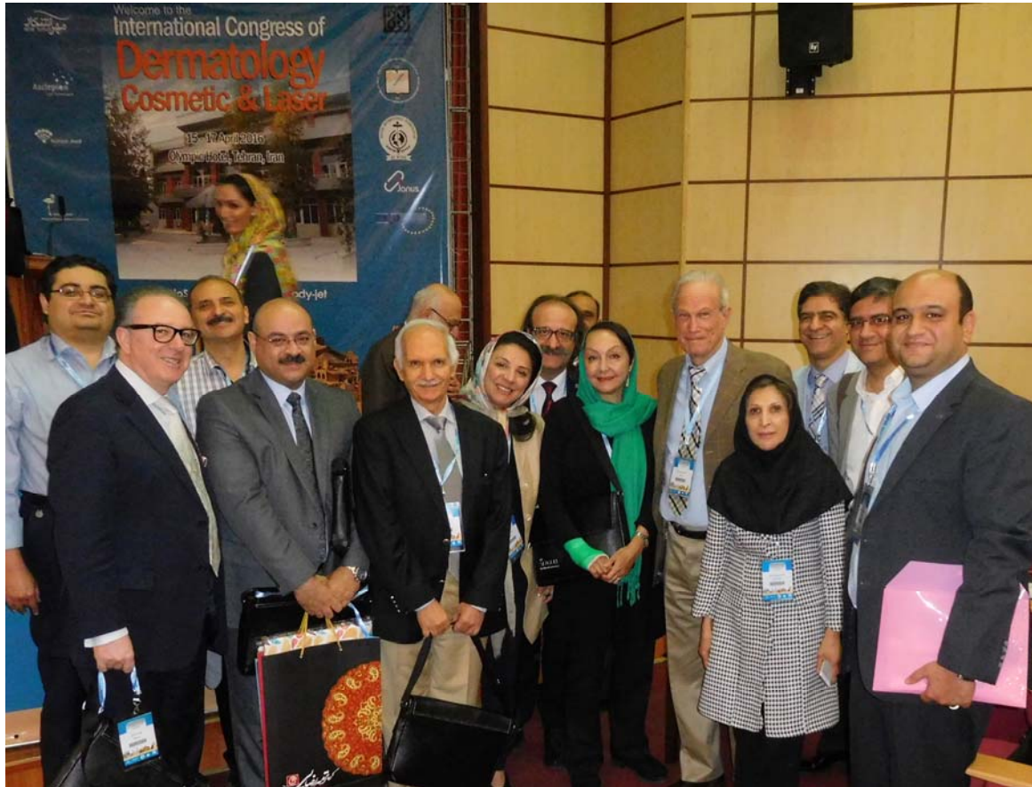
Fig 9. Closing ceremony with grateful attendees