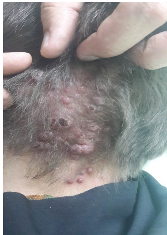
شکل ۱: پاپول ندول‌های اریتماتوی متعدد در ناحیه‌ی پس‌سری که برخی ضایعات به‌علت خارش دچار خونریزی سطحی شده‌اند.

هر ضایعه ابعادی بین ۰/۵ تا ۱ سانتی‌متر داشت و به‌علت خارش مزمن، پوست اطراف ضایعات لیکنیفیه شده و برخی ضایعات نیز زخمی شده بود. علائم حیاتی بیمار طبیعی بود و به‌جز خارش خفیف تا متوسط شکایت بالینی دیگری نداشت. بیمار سابقه‌ی بیماری سیستمیک، عفونت موضعی و تروما در ناحیه را ذکر نمی‌کرد. در سابقه‌ی مصرف دارویی بیمار، هیچ دارویی وجود نداشت. در ماه هشتم حاملگی دوم خود به‌سر