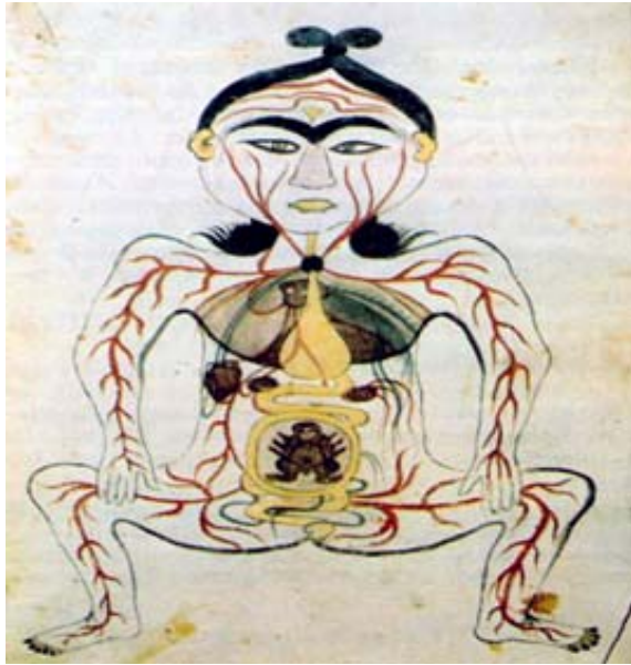
شکل ۱: نمایی از پراکندگی عروق خونی در سطح پوست از کتاب تشریح الابدان

عروق خونی فراوان و نیز مجاورت با عضلات در لایه‌های زیرین پوست دانسته شده است. در پوست منافذ باریک بسیاری وجود دارد که «مسام» نامیده می‌شوند. عضلاتی که در بخش زیرین پوست قرار گرفته‌اند نیز حاوی حس می‌باشند تا چنانچه به پوست آسیبی برسد، عضلات در زمینه دریافت حس لامسه جانشین پوست باشند. ۱۹