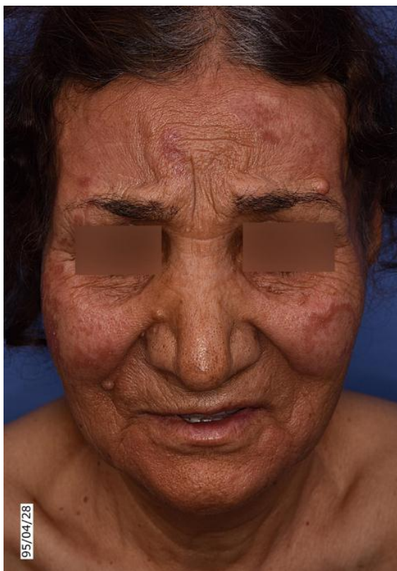
شکل ۱ الف: پلاک‌های انفیلتره و اریتماتو در هر دو گونه