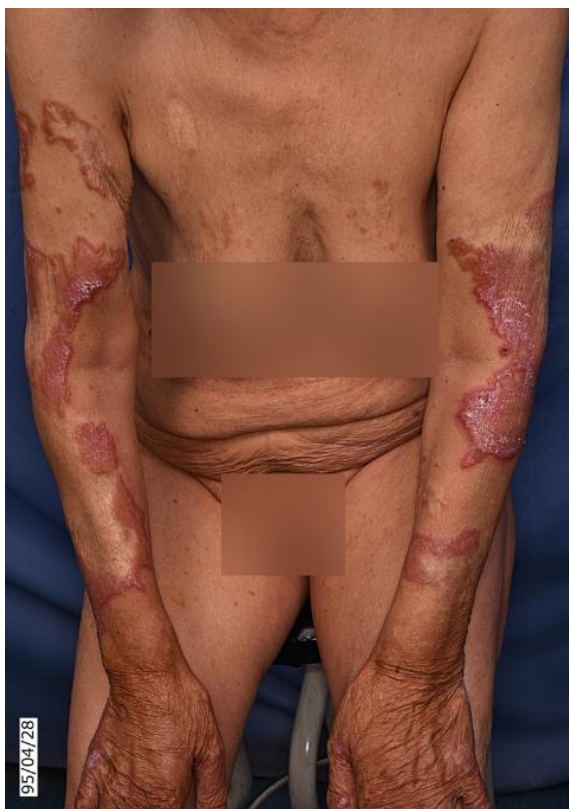
شکل ۱ ب: پلاک‌های انفیلتراتیو و وروکوز در محل اسکارهای سوختگی

بیمار از خارش شدید ضایعات شاکی بود. هیچ یافته‌ی فیزیکی دیگری دیده نشد. هم‌چنین بیمار