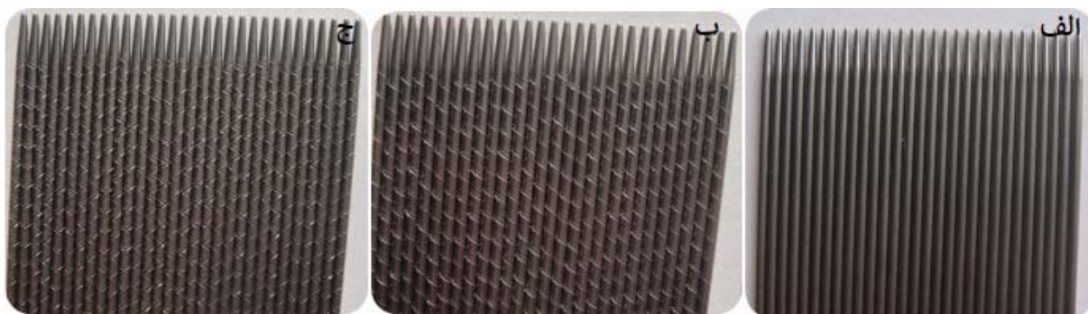
شکل ۲: شانه‌های استیل مخصوص ضد شپش؛ الف) Plain needle، ب) Screw needle و ج) Double strip needle

۳. لوسیون لیندان: این دارو به‌طور مستقیم توسط انگل‌ها و تخم‌ها جذب می‌شود، سیستم عصبی را تحریک می‌کند و باعث تشنج و مرگ سلول‌های انگلی می‌شود. ۱۳ در منابع، استفاده‌ی موضعی از لیندان به دلیل عوارض جانبی، دیگر جایگاهی ندارد؛ با این وجود لوسیون لیندان با ماده‌ی مؤثره‌ی گاما بنزن هگزا کلراید در حجم‌های ۶۰ سی‌سی به بازار عرضه می‌شود و البته این محصول دارای شانه نیست.