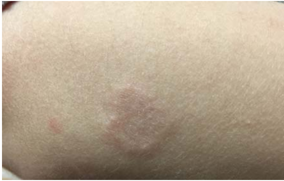
شکل ۲: پلاک آنولر متشکل از پاپول‌های کوچک و سفت در ساعد راست

گرافی با اشعه‌ی ایکس نشان‌دهنده‌ی تورم بافت نرم انگشت شست راست بود (شکل ۳). بیوپسی از ضایعه‌ی شست دست راست نشان داد که در درم پاپیلاری نواحی متعدد از رشته‌های کلاژن تخریب‌شده (نکروبیوزیس) که توسط سلول‌های التهابی هیستوسیت و لنفوسیت احاطه شده بود، مشهود است. هم‌چنین رسوب فوکال موسین در درم گزارش شد (شکل ۴). با توجه به مجموع یافته‌های آسیب‌شناسی، تشخیص بیماری گرانولوم آنولر زیرجلدی برای این بیمار مطرح گردید.