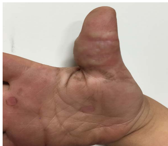
شکل ۱: ندول‌های زیرجلدی در سطح شکمی انگشت متورم شست راست

گرانولوم آنولر یک بیماری پوستی التهابی خوش‌خیم و با علت نامعلوم است که یافته‌های آسیب‌شناسی آن به صورت palisading granuloma می‌باشد. گرانولوم آنولر شامل یک نوع کلاسیک و واریانت‌های کمتر معمول به نام‌های منتشر، پرفوران، ناشی از دارو و نوع آتیپیک که در بچه‌های با نقص ایمنی اولیه گزارش شده است ۱،۲ . گرانولوم آنولر زیرجلدی به عنوان یک واریانت نادر که انحصاراً در بچه‌ها رخ می‌دهد شناخته می‌شود و ابتلا به آن پس از دهه‌ی دوم زندگی نادر است. این فرم می‌تواند تنها یا به همراه گرانولوم آنولر لوکالیزه (۲۵٪) در یک نقطه یا نقطه‌ای دیگر از بدن قبل، بعد یا هم‌زمان با آن دیده شود. گرانولوم آنولر زیرجلدی در هیستولوژی نواحی