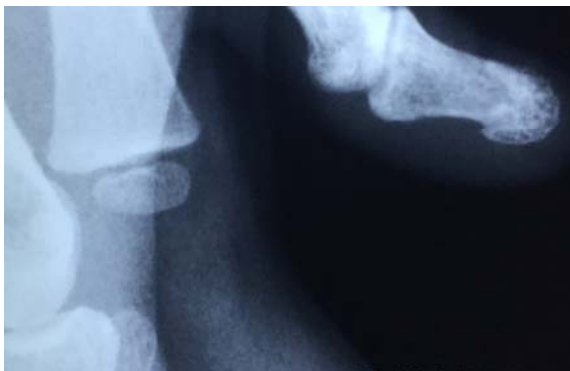
شکل ۳: تورم بافت نرم انگشت شست راست