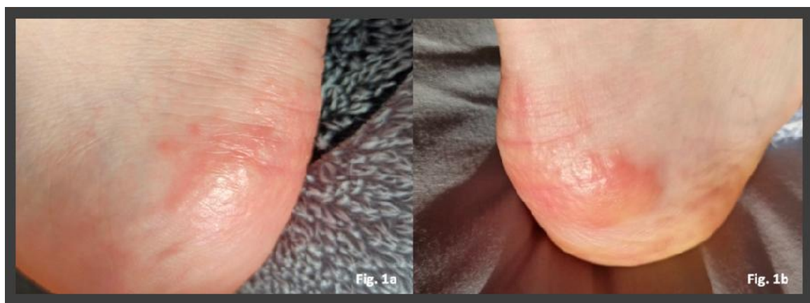
شکل ۳: پاپول‌های قرمز متمایل به زرد، ۱۳ روز پس از تشخیص کووید ۱۹

تا کنون براساس آمار ذکرشده، شیوع بیماری کووید ۱۹ در افراد زیر ۱۹ سال تنها ۲٪ گزارش شده که ۹۰٪ از آن‌ها با علائم بسیار خفیف یا به‌طور کلی