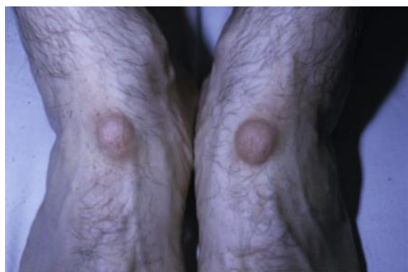
شکل ۴: ندول ورزشکاران

هیچ درمانی برای محافظت در هنگام فعالیت ورزشی مطلوب و قابل پذیرش نیست. اگر دردناک یا علامت‌دار باشد، برداشتن جراحی یا لیزر امکان‌پذیر است. استفاده از کرم اوره یا اسید سالیسیلیک برای نرم و از بین بردن بافت کراتینه شده می‌تواند مفید باشد از تزریق استروئیدهای داخل زخم نیز در گذشته استفاده می‌شده است اما معمولاً لازم نیست.