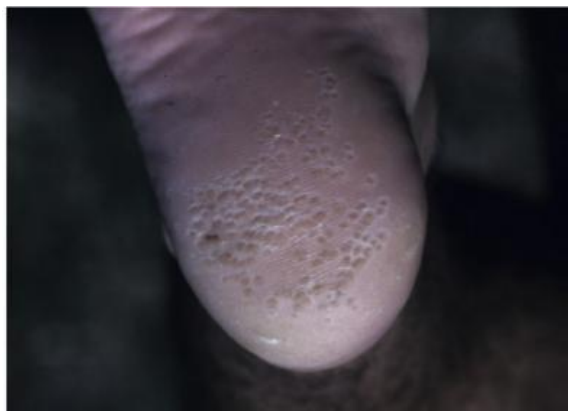
شکل ۹: کراتولیز نقطه‌ای

باید تلاش شود تا با تغییر شرایط و تعویض منظم جوراب منطقه را خشک نگه دارد. از بین بردن رطوبت به‌طور کلی عفونت را درمان می‌کند. استفاده از داروهای ضد تعریق در محل نیز می‌تواند مفید باشند. در موارد مقاوم آنتی‌بیوتیک موضعی اریترومایسین ۲٪ یا کلیندامایسین ۱٪ درمان خوبی است.