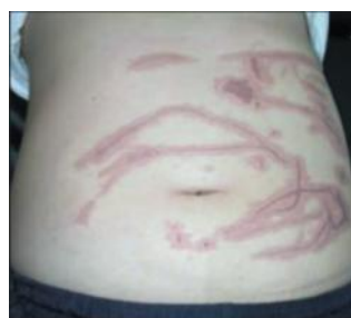
شکل ۶: گزش عروس دریایی

گزش عروس دریایی یا man-of-war stings به‌طور عادی در بین شناگران آب شور دیده می‌شوند و می‌توانند در سواحل هم وجود داشته باشند (شکل ۶). بیش از ۱۰۰ عروس دریایی سمی وجود دارد و علائم گزش از سوزش و خارش آزاردهنده تا مرگ متغیر است. شایع‌ترین تظاهرات پوستی، سوزش فوری و به دنبال آن ضایعات کهیری در یک توزیع خطی است. گاهی اوقات، ممکن است ضایعات گرانولوماتوز ایجاد شود و هفته‌ها تا ماه‌ها ادامه یابد.