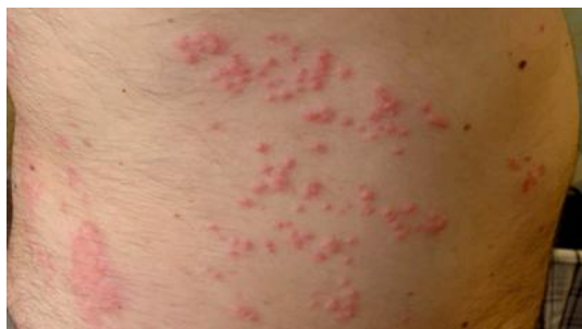
شکل ۷: بثورات دریا

بثورات می‌تواند ۳ تا ۷ روز و گاهی اوقات تا ۶ هفته ادامه یابد. درمان شامل استفاده از کمپرس یخ، آنتی‌هیستامین خوراکی و کورتیکواستروئید موضعی با قدرت متوسط است.