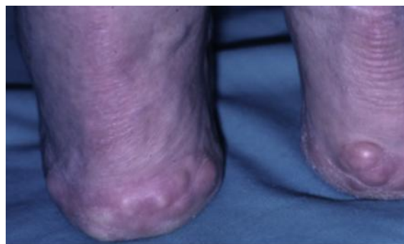
شکل ۲: پاپول‌های پیروژنیک (فتق جلدی)

التهاب پوستی سایشی نوک پستان که به دلیل تکراری بودن اصطکاک پیراهن ورزشکار روی نوک سینه‌های بیرون‌زده ایجاد می‌شود. در هنگام دویدن مردانی که به مدت طولانی پارچه‌های سخت مانند