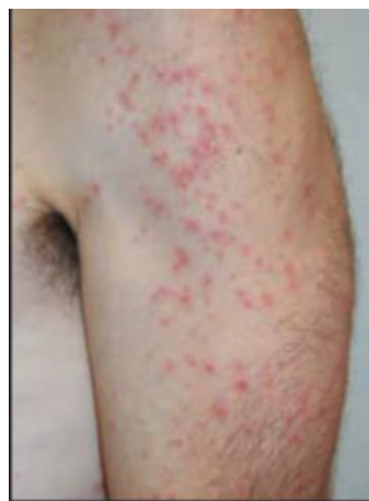
شکل ۸: خارش شناگر

درمان‌های موضعی می‌توانند سبب ACD پا شوند. از بیمار بپرسید آیا از دارو برای پا استفاده می‌کند یا بوگیر را داخل کفش اسپری می‌کند؟ بنزوکائین و لانولین موضعی که در بسیاری از داروها و کرم‌ها استفاده می‌شوند شایع‌ترین علت ACD در پاها گزارش شده‌اند.