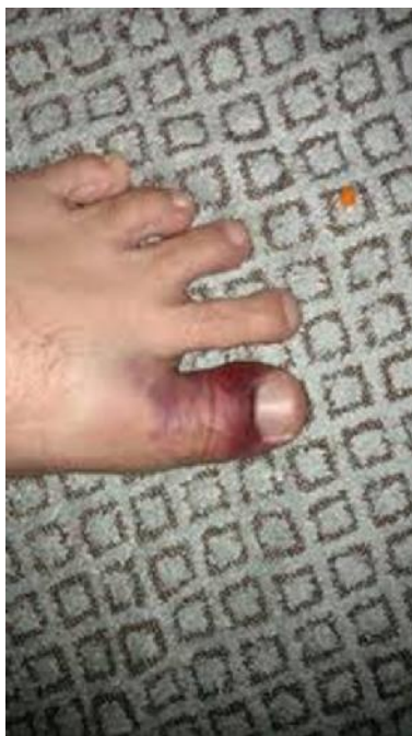
شکل ۳: پنجه چمن