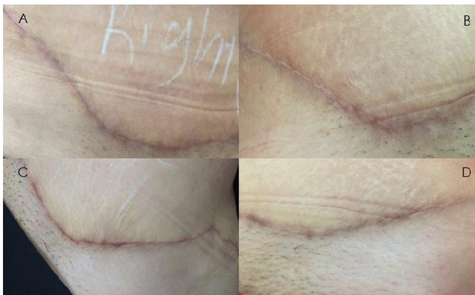
شکل ۲: ظاهر اسکار ابدومینوپلاستی در خانم ۴۶ ساله؛ (A) سمت شاهد در پایان هفته سوم پس از جراحی، (B) سمت شاهد در ویزیت نهایی، (C) سمت لیزر تراپی در پایان هفته سوم پس از جراحی، (D) سمت لیزر تراپی در ویزیت نهایی.

بهبود ظاهر اسکار مؤثر است اما باید مطالعات بیشتری در این زمینه انجام شود. ۱۳،۱۴