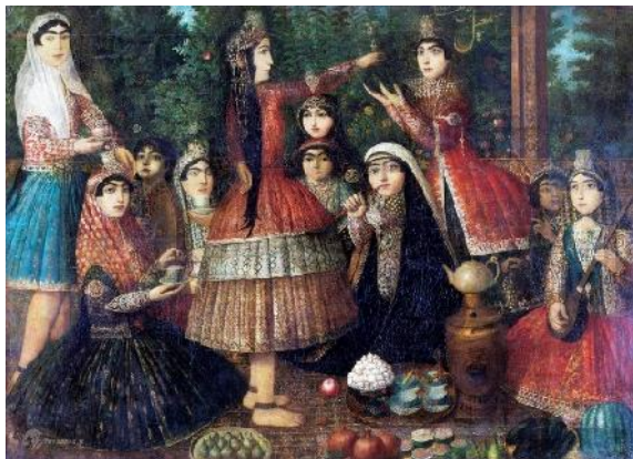
شکل ۴: بزم عصرائه زنان خضاب‌شده در دوره قاجار، موزه ویکتوریا و آلبرت.

قبل از استعمال آن موها یا ریش را با آب صابون تندی کاملاً شست‌وشو می‌دهند تا چربی‌هایی که از عرق ریختن تولیدشده، زدوده شود. آن‌گاه مقدار زیادی آب گرم روی سر می‌ریزند تا صابون‌ها پاک شود، سپس تا آن‌جا که ممکن است ریش و مو را خشک می‌نمایند. در این حال خمیر را بر روی قسمت‌های موردنظر می‌گذارند به طوری که تمام موها را آغشته می‌کند و می‌پوشاند. وقتی که از این امر فارغ شدند، دلاک‌ها عملیات استحمام را به شرحی که گذشت شروع می‌کنند. کار کیسه‌کشیدن که همیشه یک ساعت و نیم تا دو ساعت طول می‌کشد برای این‌که موها به خوبی رنگ بگیرند کاملاً کافی است. سرانجام این خمیر را با آب گرم می‌شویند و با شانه ظریفی شانه می‌کنند تا آن مقدار خمیری که هنوز در موها باقی مانده است، خارج شود.