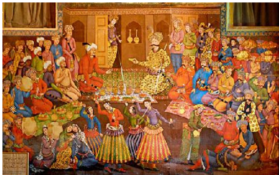
شکل ۲: ترسیم از ایرانیان خضاب‌شده در دوران شاه عباس کبیر در مجلس شاهی.

گاسپار دروویل، صاحب منصب نظامی و سفرنامه‌نویس فرانسوی است که در سال‌های ۱۸۱۳-۱۸۱۲ در پانزدهمین سال سلطنت فتحعلی‌شاه قاجار و ولایت‌عهدی عباس میرزا در ایران اقامت داشته است.