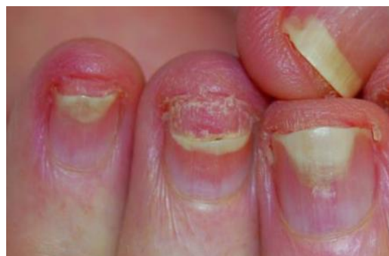
شکل ۲: پسوریازیس بستر ناخن با اونیکولیز.

در ناخن‌های پسوریازیس به‌جز اختلالات بافت ناخن، ناهنجاری‌هایی در مویرگ‌های خونی مطرح است که ممکن است منجر به کاهش دفاع طبیعی در برابر میکروارگانیسم‌ها شود. ۱۴ علاوه بر این، اونیکولیز (جداسدن صفحه ناخن) باعث ایجاد یک محیط مرطوب می‌شود که به نفع تکثیر قارچ می‌باشد. ۱۵ شایع‌ترین ویژگی‌های بالینی اونیکومایکوزیس، هایپرکراتوز زیر ناخی، اونیکولیز و تغییر رنگ می‌باشد؛ بنابراین اونیکومایکوزیس می‌تواند شبیه به پسوریازیس ناخن باشد و بعضی اوقات تشخیص و تفکیک بالینی آن‌ها از یکدیگر بسیار دشوار می‌شود. ۱۶ با توجه به اینکه همراهی این دو بیماری در جمعیت عمومی بسیار شایع است؛ بنابراین پزشکان برای تأیید /