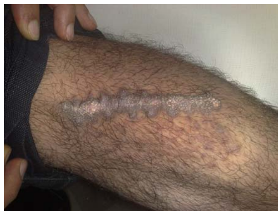
تصویر ۱: پلاک خطی هیپرکراتوتیک قهوه‌ای‌رنگ در محل اسکار در قسمت قدامی ساق پای چپ.

در ارزیابی اولیه‌ی بیوشیمیایی شامل شمارش و افتراق سلول‌های خونی، سدیمانتاسیون گلبول‌های قرمز، بیوشیمی و آزمون‌های کبدی و کلیوی و لیپیدهای سرم طبیعی بود.