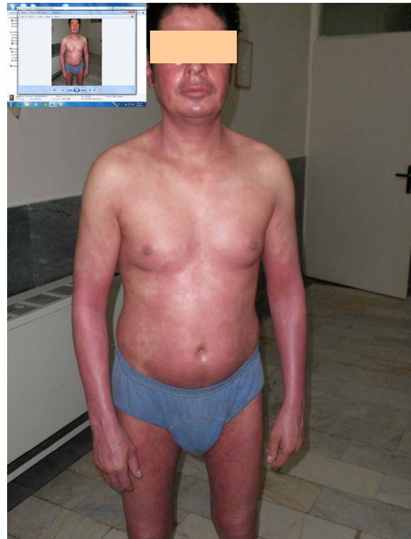
تصویر ۱: بچ و پلاک های اریتماتو متعدد در تنه، صورت و اندامها همراه پوسته ریزی و پوست خشک.

طی ۶ ماه گذشته بیمار در مرکز دیگری با تشخیص احتمالی پسوریازیس تحت درمان با نئوتیگازون به میزان ۲۵ میلی گرم روزانه و استروئید موضعی قرار گرفته بود که نتیجه ی مناسبی حاصل نشده و حتی ضایعات رو به بدتر شدن رفته بود. ما ابتدا یک اسمیر مستقیم از ضایعات با خراشاندن