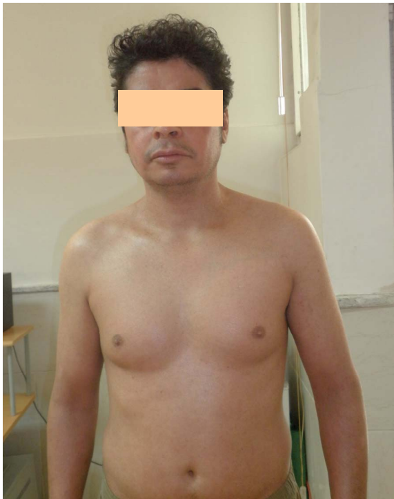
تصویر ۳: بعد از درمان با فلوکونازول خوراکی و کلوتریمازول موضعی، ضایعات کاملاً ناپدید شد.

بعد از توقف مصرف استروئید موضعی، بیوپسی های متعدد از نقاط مختلف انجام شد که در بررسی آسیب شناسی در پس زمینه ی ایکتیوز، قارچ های متعدد PAS + در لایه ی شاخی اپیدرم ظاهر شد (تصویر ۲). اسمیر مستقیم نیز تکرار شد که آن هم میسلیم های شاخه شاخه را نشان داد. کشت قارچ از نظر تریکوفیتون روبروم مثبت شد. هیچ منبع خاصی برای درماتوفیتوز بیمار پیدا نشد و بیمار سابقه تماس با هیچ حیوانی را نداشت. بیمار با فلوکونازول خوراکی روزانه ۱۰۰ میلی گرم و کلوتریمازول موضعی به مدت یک ماه درمان شد. به علت پاسخ دراماتیک، درمان با فلوکونازول خوراکی به میزان ۱۵۰ میلی گرم در هفته به مدت ۷ هفته دیگر ادامه داده شد تا این که ضایعات کاملاً برطرف (تصویر ۳) و نتیجه ی اسمیرهای مستقیم از نظر وجود قارچ منفی شد.