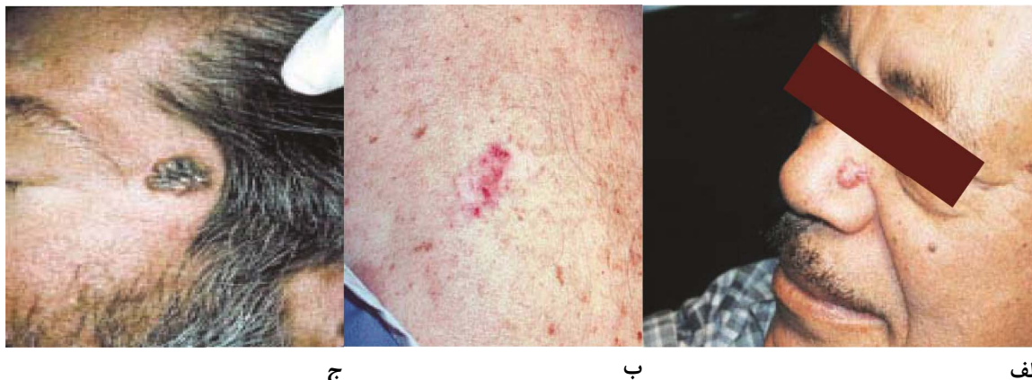
شکل ۱: انواع کارسینوم سلول بازال؛ الف) ندولار ب) سطحی ج) pigmented ۶

ناحیه‌ی بینی است. در ۱۵٪ الی ۴۳٪ موارد ناحیه‌ی گردن درگیر می‌شود. ۲۰٪ موارد بروز کارسینوم سلول بازال در ناحیه‌های پوستی که کمتر در معرض تابش نور خورشید می‌باشند، دیده می‌شود. نئوپلاسم‌های ناحیه‌ی حفاظت‌شده در مقابل نور و یا در نواحی چین‌دار، خطرناک‌تر می‌باشند زیرا دیر تشخیص داده شده و ممکن است باعث پیش‌آگهی بد، مرگ‌ومیر حین عمل جراحی و متاستاز شوند. ۳