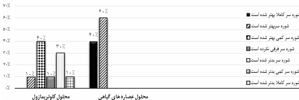
شکل ۳: میزان رضایت داوطلبین

درمان‌های مختلف شیمیایی و گیاهی برای شوره‌ی سر و درماتیت سبورئیک موجود است. از سال‌ها قبل در بسیاری از نقاط جهان از خواص درمانی متعددی که گیاهان داشتند در درمان بسیاری از بیماری‌ها از جمله شوره‌ی سر استفاده می‌شد. گیاهان با خواص دارویی می‌توانند درمان ارزان‌تر و بی‌خطرتری نسبت به بسیاری از داروهای شیمیایی باشند. مطالعات مختلفی در ارتباط با اثر ضدشوره‌ی برخی گیاهان