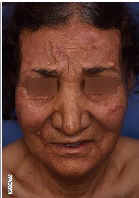
شکل ۱ الف: پلاک‌های انفیلتره و اریتماتو در هر دو گونه