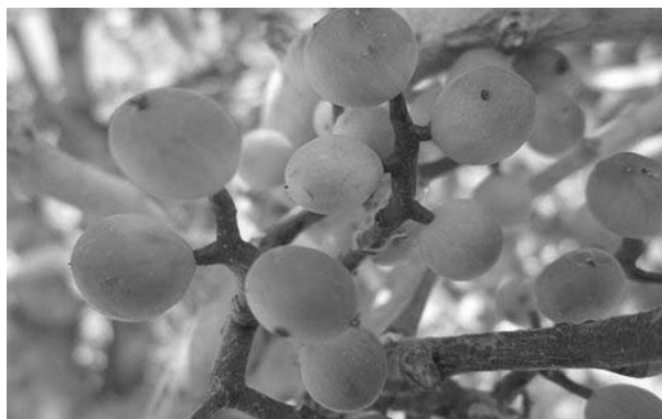
شکل ۱: درخت و میوه‌ی بنه