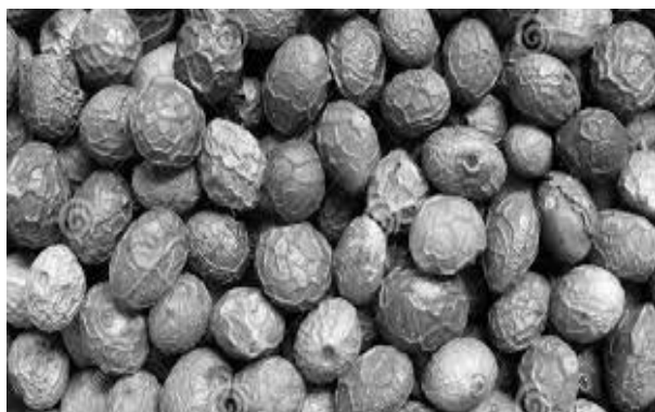
شکل ۲: میوه‌ی خشک بنه

با توجه به خاصیت آنتی‌باکتریال و آنتی‌اکسیدانی این گیاه و فراوان بودن آن در طبیعت و اینکه عوارض جانبی داروهای با منشأ طبیعی به نظر کمتر می‌باشد روی آوردن به سمت گیاهان و تحقیق در این راستا کاری منطقی به نظر می‌رسد. با توجه به اثرات ضدالتهابی عصاره‌ی بنه، شاید بتوان لوسیون یا