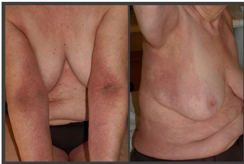
شکل ۲: راش اریتماتو در ناحیه انته کوبیتال در بیمار دیابتیک

یک خانم ۶۴ ساله‌ی دیابتیک، ۴ روز پس از شروع تب ۴۰ درجه و ضعف جنرالیزه، دچار راش اریتماتو در ناحیه‌ی انته کوبیتال دوطرف با گسترش به ناحیه‌ی تنه و زیر بغل می‌شود و به تدریج سرفه نیز به علائم بیمار اضافه می‌شود. علائم پوستی بیمار پس از گذشت ۵ روز و تب و علائم تنفسی در عرض ۱۸ روز بهبود پیدا می‌کنند. براساس درگیری سی تی اسکن ریه و PCR بیمار تشخیص کووید ۱۹ گذاشته می‌شود. در این مطالعه راش بیمار یادآور Symmetrical Drug-Related Intertriginous and Flexural Exanthema (SDRIFE) بوده که بیشتر در همراهی با مصرف برخی داروها گزارش شده؛ البته به ندرت در برخی از مطالعات همراهی این ضایعه با عفونت‌های ویروسی همچون