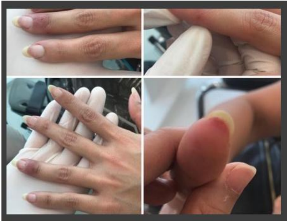
شکل ۷: راش ماکولوپاپولر در دو بیمار کووید ۱۹ بدون علائم تنفسی و تب