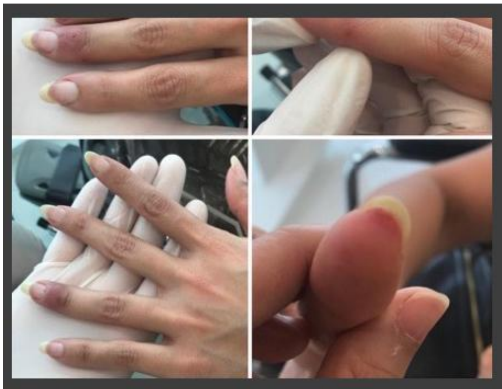
شکل ۷: راش ماکولوپاپولر در دو بیمار کووید ۱۹ بدون علائم تنفسی و تب