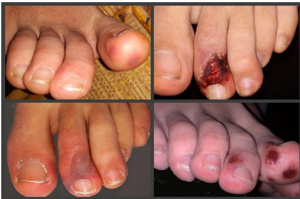
شکل ۶: ضایعات عروقی در انتهاها در بیماران کووید ۱۹

از نظر کووید ۱۹ انجام نشده اما همزمانی گسترش این تظاهرات پوستی در سراسر جهان و همه‌گیری جهانی