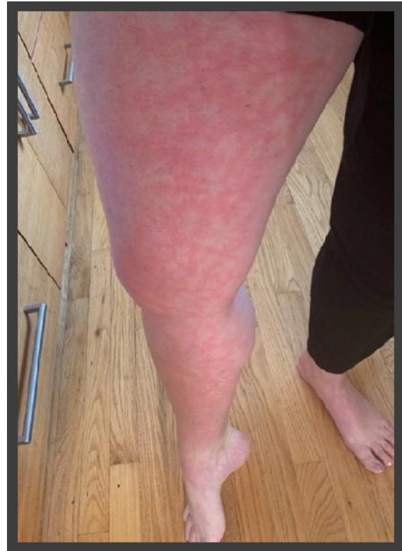
شکل ۵: ضایعات لیودورتیکولاریس

با در نظرگیری این مطالعه و گزارشات قبلی می‌توان ایسکمی نواحی اکراال را تظاهر نادری از بیماری کووید ۱۹ دانست و متخصصان درماتولوژی به‌عنوان خط اول مواجهه با بیمارانی با این تظاهرات پوستی، باید همواره بیماری کووید ۱۹ را در نظر داشته باشند ۱۵ .