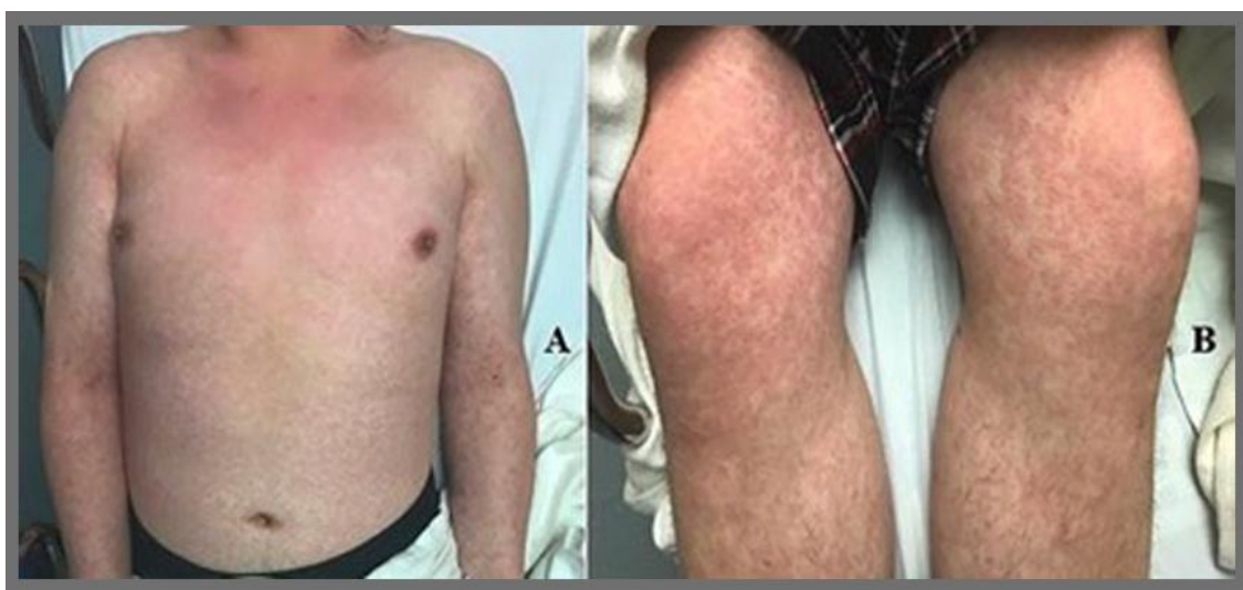
شکل ۱: راش گسترده ماکولوپاپولر در بیمار ۲۰ ساله

در ۱۷ مارچ ۲۰۲۰ یک مورد جالب در مجله‌ی JAAD گزارش شده که به بررسی یک بیمار تایلندی با تشخیص اولیه‌ی Dengue viral hemorrhagic fever پرداخته است. بیمار در ابتدا بدون تب و علائم تنفسی و تنها با راش پوستی همراه با پورپورا و پلاکت پایین به پزشک مراجعه می‌کند و با توجه به شیوع بالای تب