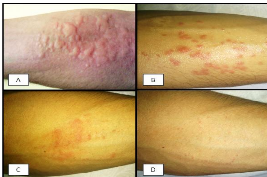
شکل ۲: واکنش‌های آلرژیک پوستی ناشی از گزش ساس تخت خواب بر روی دست انسان. A: ۲۴-۱۲ ساعت بعد از گزش؛ B: ۲ روز بعد از گزش؛ C: ۵ روز بعد از گزش و D: ۷ روز بعد از گزش