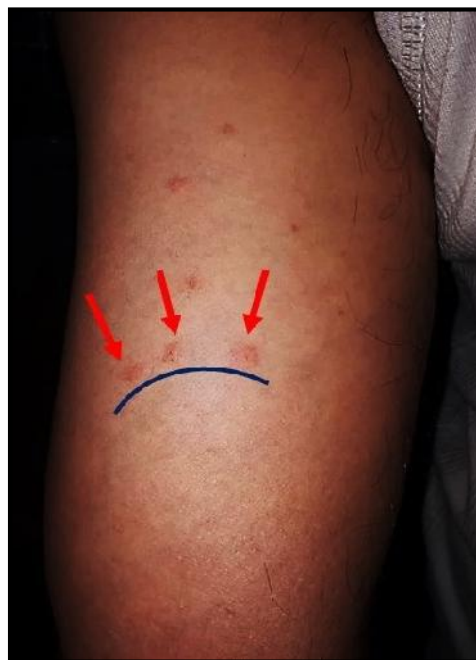
شکل ۳: ترکیب خطی بر روی بازوی فرد «صبح، ظهر و شب»

نتایج مطالعه وانگ و همکاران (۲۰۱۶) نشان داد که تنها ۶۸٪ از ساکنین منازل آلوده نسبت به گزش