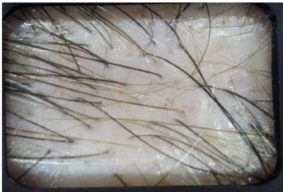
شکل ۱: تفاوت (هتروژنیته) در ضخامت ساقه‌ی مو در آلوپسی آندروژنتیک