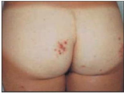
شکل ۱۰: Bikini bottom