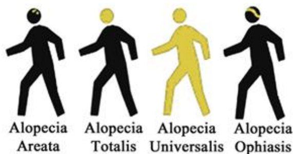
شکل ۲: برخی از انواع مهم آلوپسی