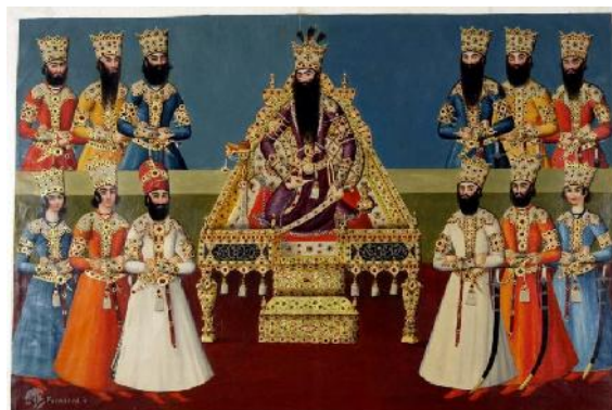
شکل ۳: ترسیمی از چهره خضاب شده و زیبای فتحعلی شاه و درباریان ایران در دوره قاجار (موزه لوور).

دروویل معتقد است ایرانی ها همیشه ریش و موی سر را در حمام رنگ می کنند. این عمل به سادگی انجام می گیرد و از خطرات ناشی از استعمال داروهایی که شارلاتان های لندن و پاریس به این اسم به قیمت طلا می فروشند، به دور هستند و بالعکس برای مو فوق العاده مفید است؛ زیرا باعث نمو و پرپشت شدن آن می گردد. به این منظور از گرد بسیار نرمی که از ساییدن برگ خشک شده درخت رنگ به دست می آید، استفاده می نمایند. گرد مزبور را در مقدار کمی آب می خیسانند و خمیر شلی از آن تهیه می کنند.