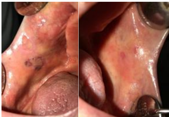
شکل ۱: زخم‌ها و اروژن‌های متعدد در مخاط باکال.