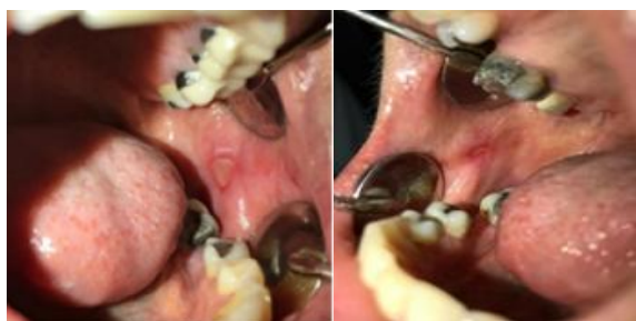
شکل ۲: زخم‌های دوطرفه.

و کاهش تعداد کلنی نسبت به گروه مواجهه با نیستاتین نیز دیده شد ( P < 0.001 ) (شکل ۳). در گونه‌های مقاوم لیزرخورده با ۸۱۰ نانومتر، تعداد کلونی‌ها به‌طور معنی‌داری کاهش و تقریباً به نصف رسیده بود ( P < 0.001 ) و کاهش تعداد کلنی نسبت به گروه مواجهه با نیستاتین نیز دیده شد ( P < 0.001 ) (جدول ۱). گروه کنترل مثبت پلیت حاوی ک.آلبیکنس استاندارد بدون مواجهه با لیزر و نیستاتین بود و گروه کنترل منفی فقط شامل محیط کشت بود (جدول ۱). نتایج تست‌های حساسیت دارویی هیچ