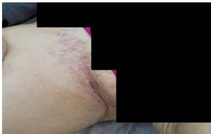
شکل ۲: تغییرات آسیب‌شناسی نمونه پوست بیمار دو ماه پس از درمان.